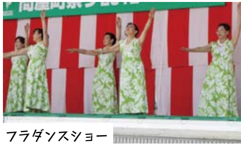
フラダンスショー