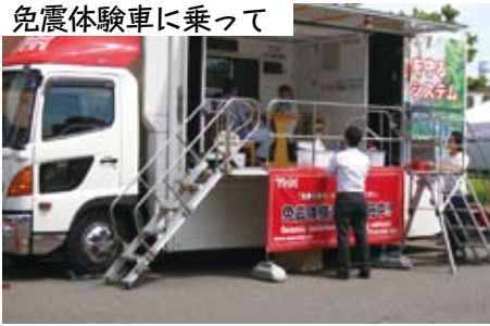
免震体験車に乗って