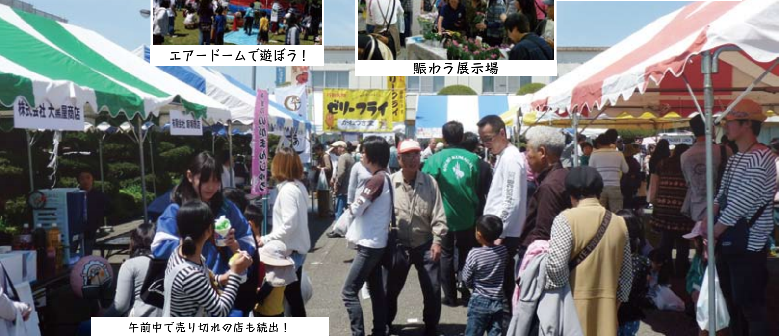
午前中で売り切れの店も続出!