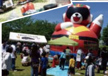
エアードームで遊ぼう!