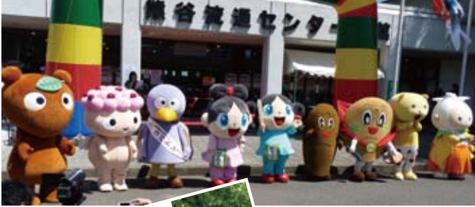
ゆるキャラ®大集合