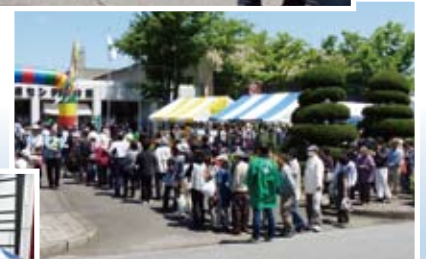
あっという間に長い行列