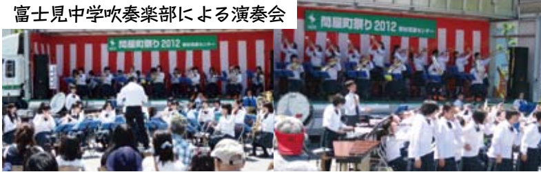
富士見中学吹奏楽部による演奏会